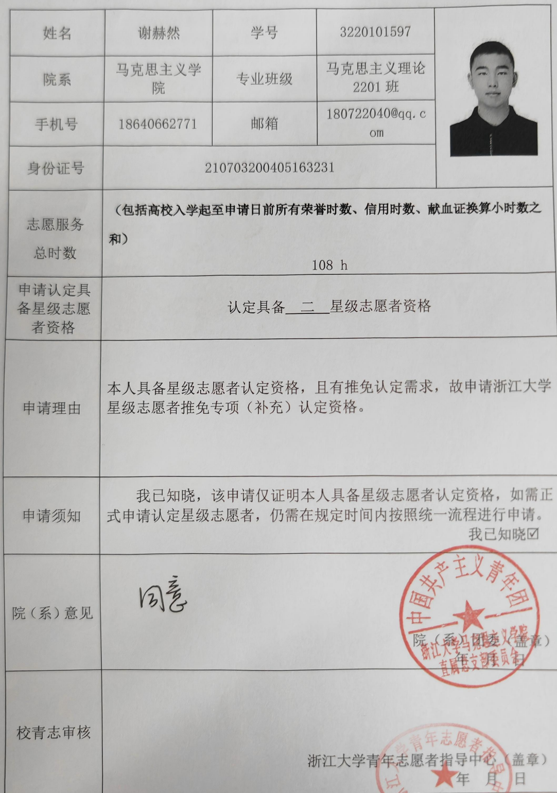
浙江大学星级志愿者（补充）认定资格申请表